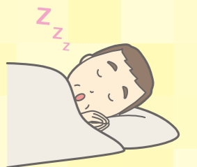
とうけいきょう 2024年8月号より抜粋

他には良い習慣として、 運動や太陽光を浴びる 、 朝食をしっかり食べる 、 布団に入る前の1~2時間前に入浴 など。寝つきをよくするために寝る前にアルコールを飲むと、かえって交感神経刺激し脳を覚醒させることがあるので注意が必要。