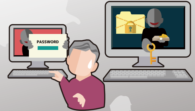
とうけいきょう 2024年8月号より抜粋